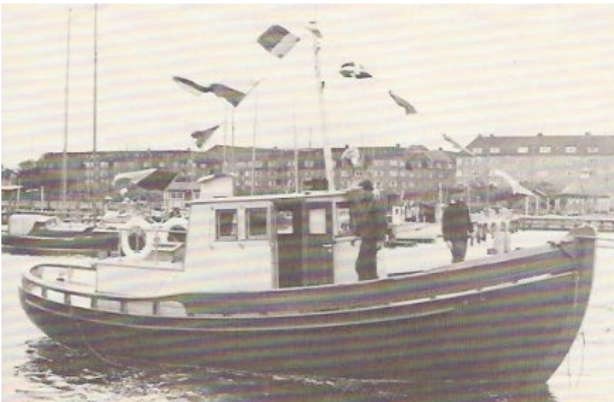
Lodsbåden Ran, som løb af stabelen 2. juli 1964, var den sidste lodsbåd, som lodseriets 4 lodser købte.

Ran var en 10 tons lodsbåd med en 62 HK 4. cyl. Bukh motor. Den blev bygget af skibsbygmester Henry Rasmussen i Aalborg