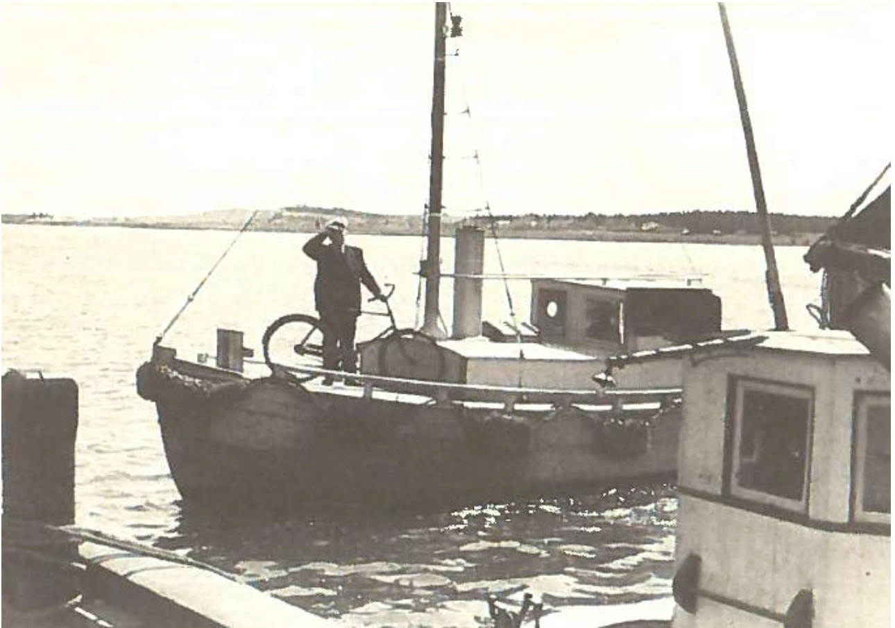
Lods P.A. Gruelund var stationeret i Randers og ses på fotoet sammen med sin cykel ved Udbyhøj efter en lodsning fra Randers omkring 1950 - parat til at cykle de 31 km tilbage til Randers.