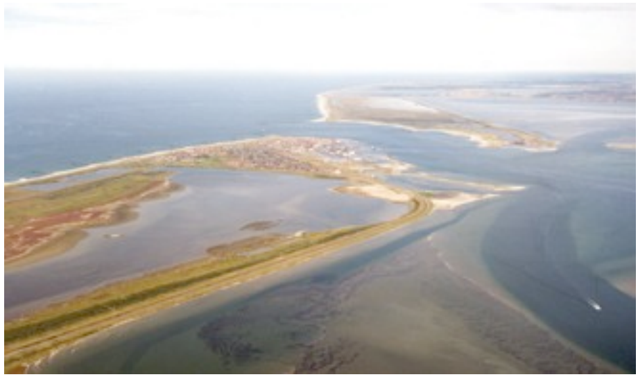
Fotoet viser Thyborøn Kanal og Agger Tange i baggrunden. Til venstre ses de mange høfde, der er anlagt langs Vesterhavets kyst og kanalen. Foto og tegning: Kystdirektoratet.

Agger Tanges og Thyborøns lodshistorie begyndte efter stormfloderne i 1825 og 1862, hvor havet brød gennem den lange tange ud mod Vesterhavet, så det blev muligt at sejle ind i Limfjorden. Høfderne blev anlagt i perioden 1875-1892.