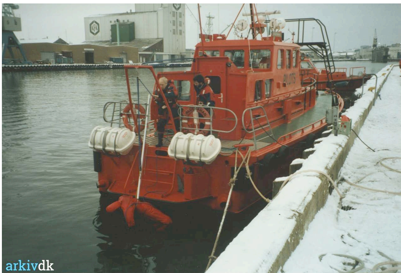
På det øverste foto, der er fra ca. 1940, ses Thyborøn Lodseris lodskutter foran alle fiskekutterne. Nedenfor ses en lodsbaad ved kajen i Thyborøn Havn i 1995.