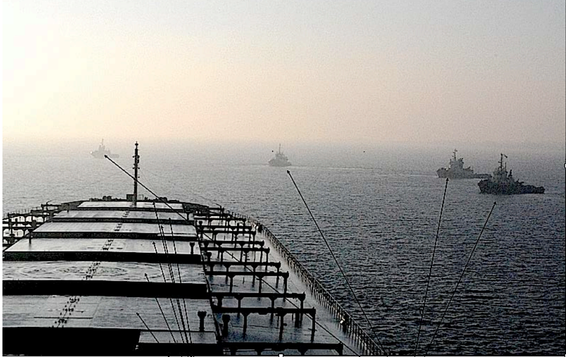
Cape Frontier på vej til Stignæs