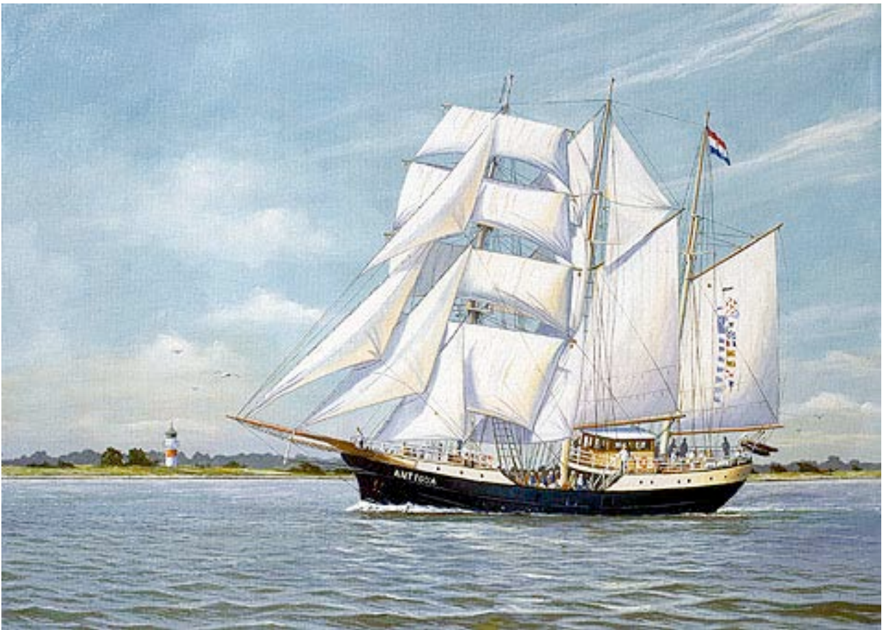
Her ses sejlskibet Antigua med Årø og Årøs fyrtårn i baggrunden. Malet i 2002, 70 x 50 cm