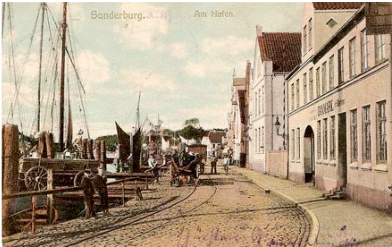
Postkortet viser havnens jernbanespor og dens havneaktiviteter samt det gamle Hotel Danmark. Nedenfor ses til højre Sønderborgs delvist ødelagtemoler efter 1864.