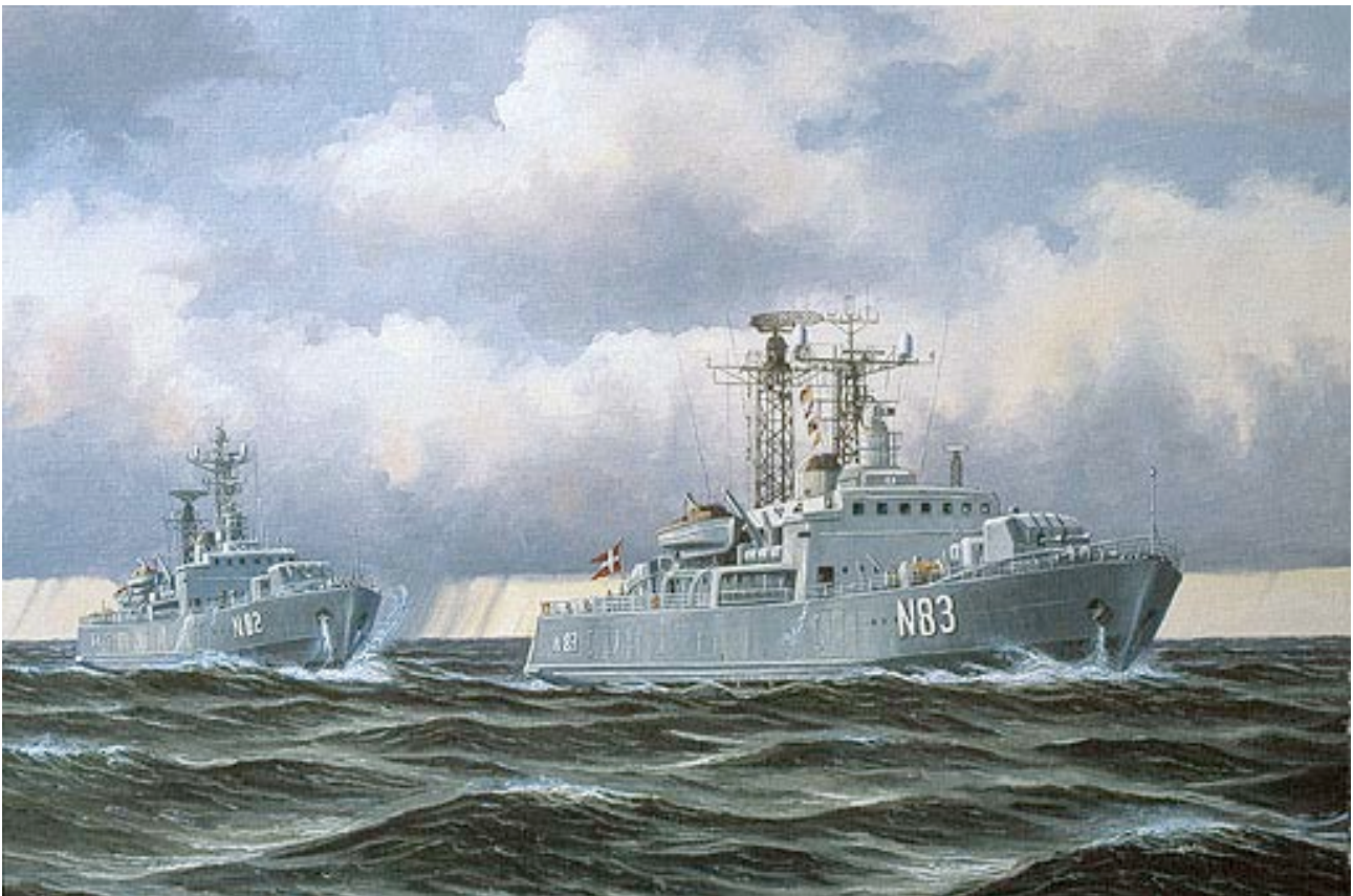
Minelæggerne Sjælland, søsat i 1964 og Møen, søsat i 1963. Malet i 1995, 100 x 70 cm.