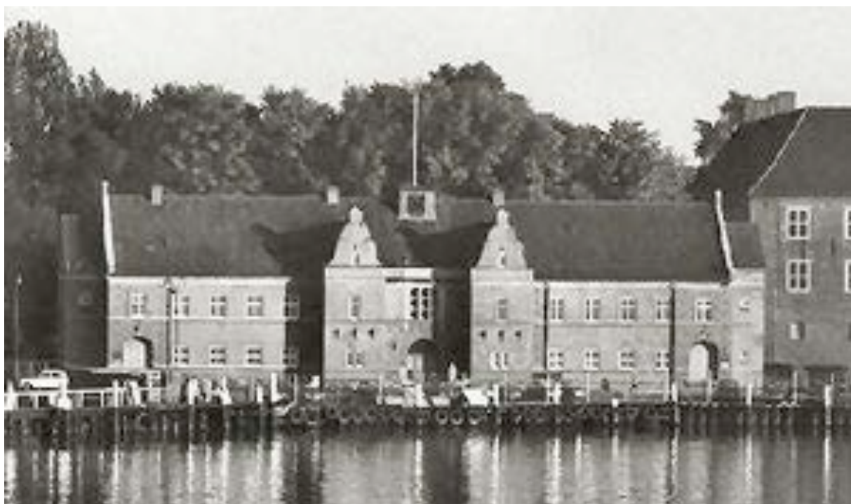
Sønderborgs store opland var af stor betydning for havnen, hvilket understreges af toldboden på fotoet til venstre. Den store toldbod blev opført i 1926 og afløste en tidligere toldbygning opført i 1856. Men den nye toldbodbygning fik et kort liv. For bygningen blev revet ned i 1975.