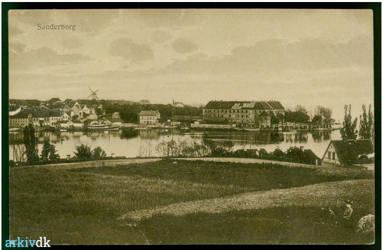
Sønderborg Havn med Dybbøl Mølle og Sønderborg Slot i slutningen af 1800-tallet.