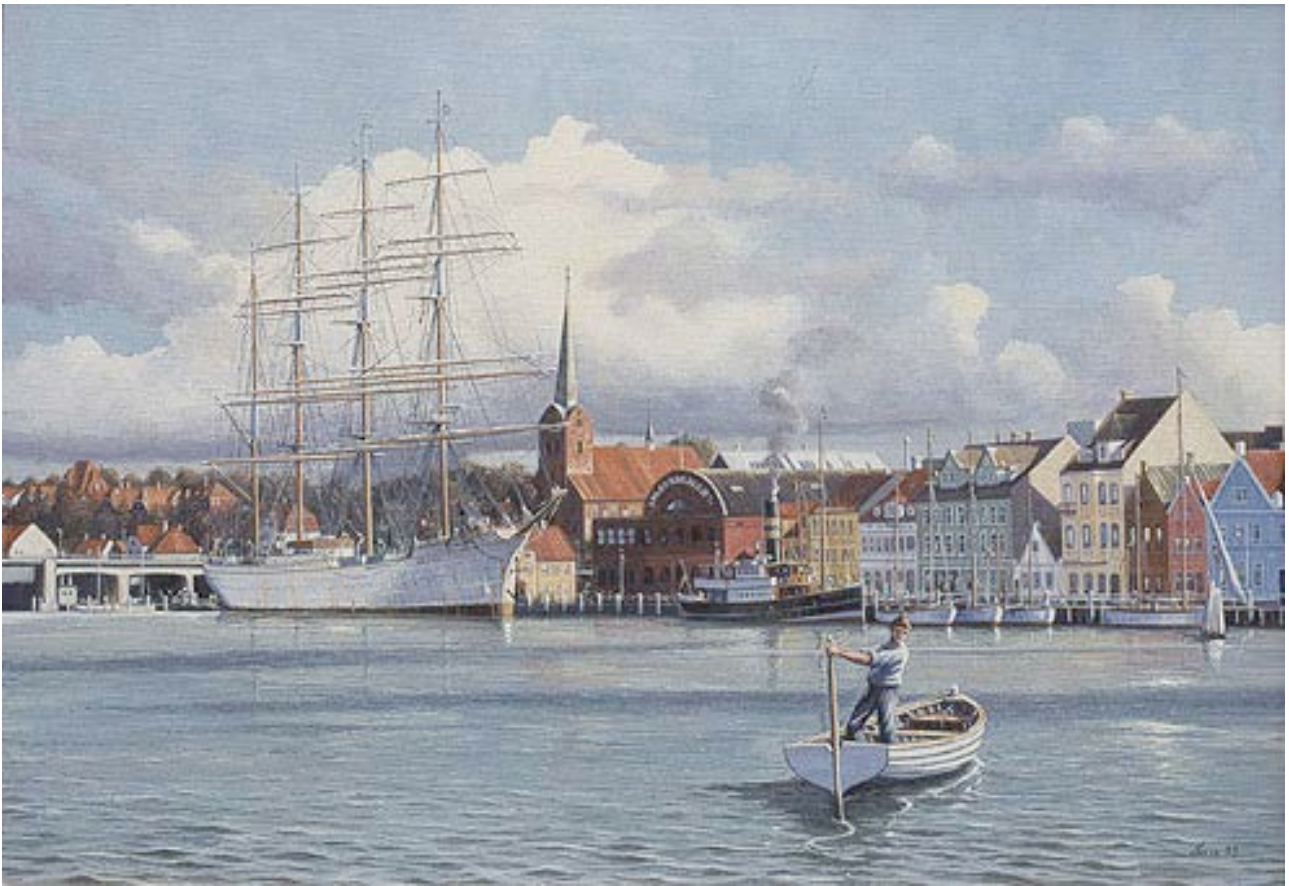
Sedov og damperen Alexandra malet i 1993, 100 x 70 cm, nederst Dannebrog. Malet i 1996, 125 x 85 cm.