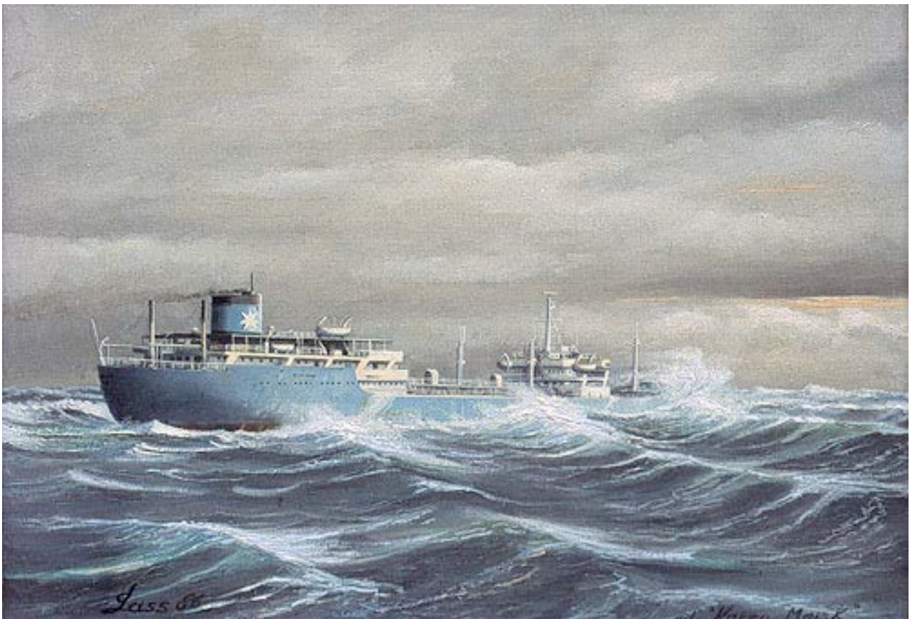
Nedenfor ses Karen Mærsk på Atlanterhavet. Malet i 1986, 50 x 35 cm.