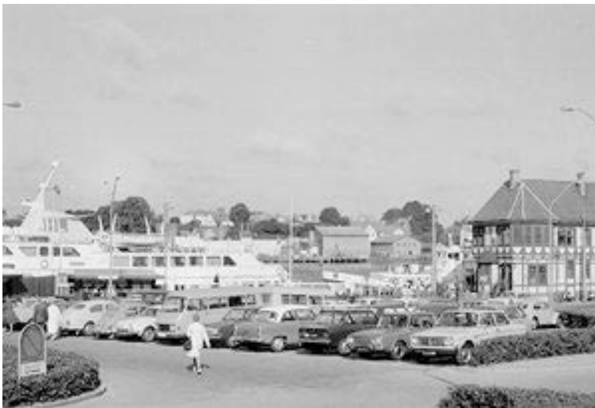
Efter genforeningen i 1920, hvor den dansk-tyske grænse også blev trukket i Flensborg Fjord, opstod der en livlig trafik, bl.a. fra 1950'erne af de såkaldte spritbåde, hvilket fotoet med både, busser og biler langs kajen illustrerer. Det todfrie salg blev bremsset af EUs regler i 1999.