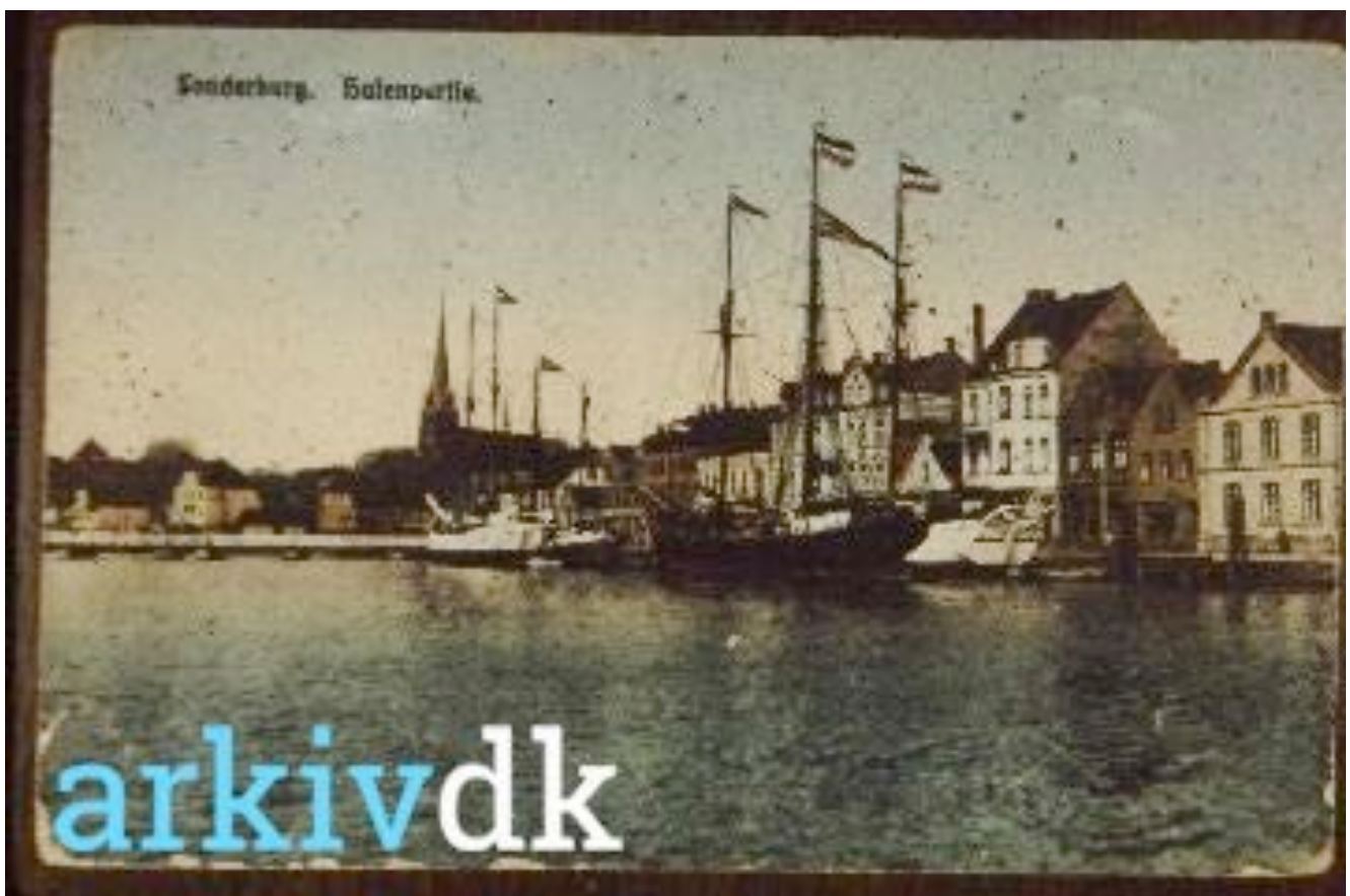
Sønderborg Havn i slutningen af 1800-tallet.