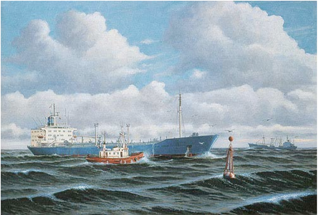
Ovenfor ses Skaw Pilot fra Skagen på vej til Elo Mærsk ud for Skagen. Malet i 1998, 100 x 70 cm.