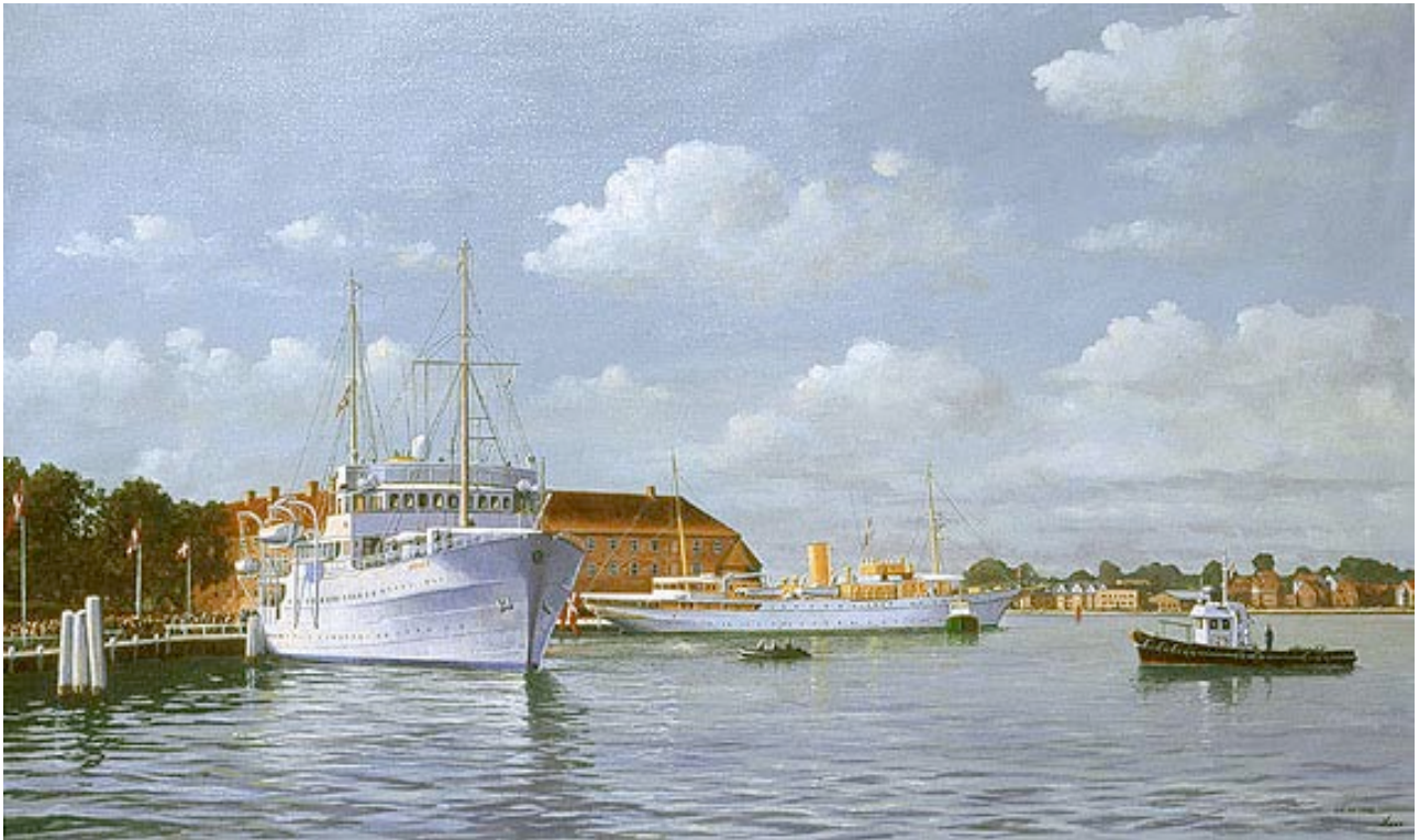
Ovenfor ses kongeskibene Dannebrog og Norge med Sønderborg Slot i baggrunden. Malet i 1998, 160 x 90 cm. Nedenfor ses kongeskibet Dannebrog og skoleskibet Danmark med Sønderborg Slot i baggrunden. Malet i 2010. Sønderborgs lodsbåd er med på begge motiver.