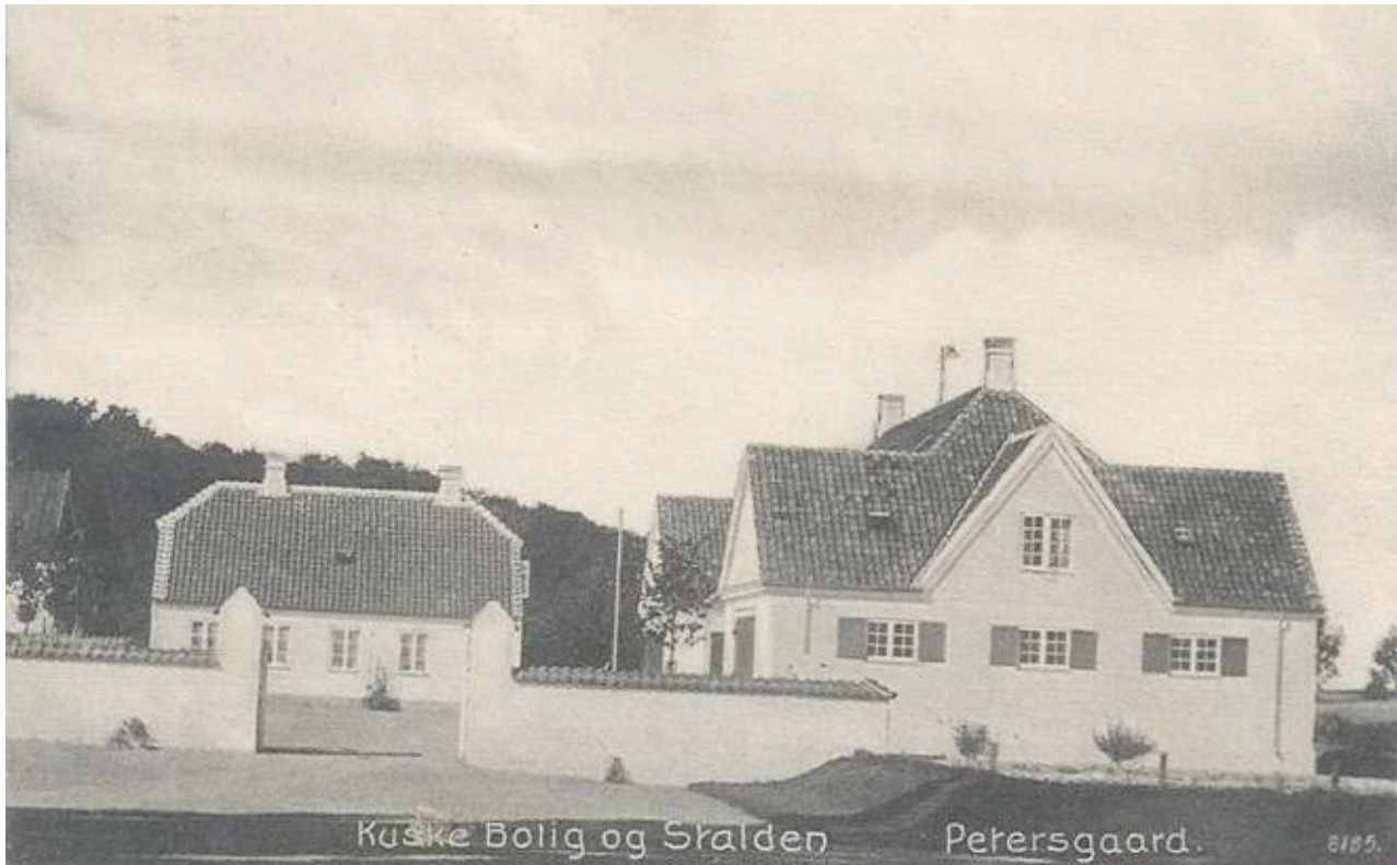
Postkortet viser sidebygningen med kuskebolig og stald til den smukke hovedbygning Petersgaard.