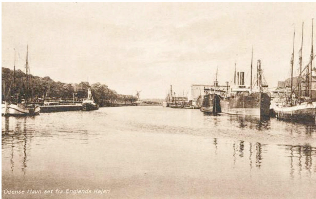
Odense Havn set fra Englands Kajen

Fotografierne illustrerer den udvikling og aktivitet, som kanalen fik for byen.