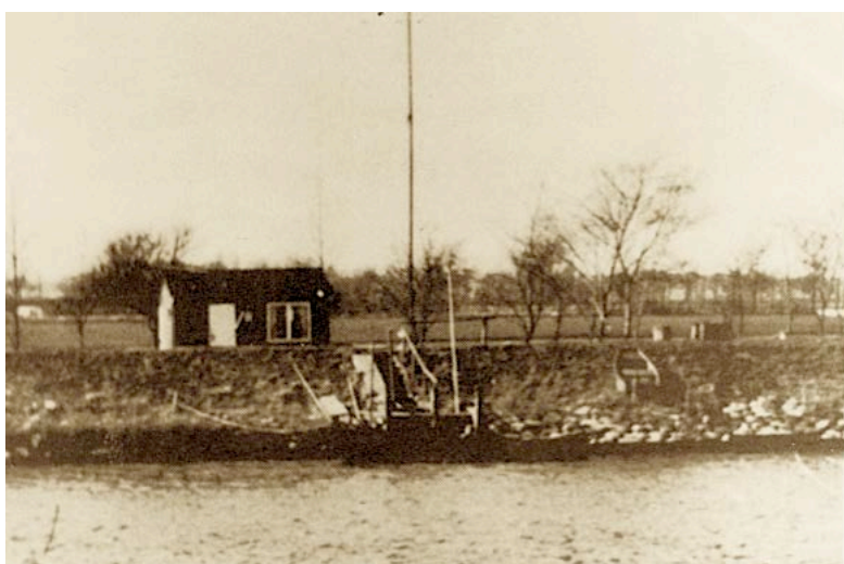
Den 5 km lange kanal fra Odense til Odense Fjord havde tidligere et lille lodshus ved Stige, der ses til venstre.

Lodserne i Stige overtog lodsningen af skibene fra Gabet, som lodserne i Gabet stod for, og lodsede til og fra Odense Havn. Lodsrueten er 21 km.