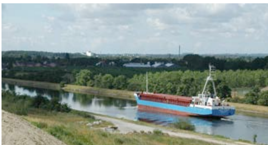
I dag sejler store skibe med en længde på op til 160 m ind til Odense Havn. Her ses et Mærsk skib.

Odense Kanal fra DanPilots lodsstation ved Gabet. Men lodseriet i Stige fungerede som lodseri for lodsningen fra Odense Fjord til Odense Havn i omkring 180 år. Odense var ikke en søfartsby som de fynske havnebyer. Men omkring 1870 var alligevel knap 80 sejlskibe hjemmehørende i Odense.