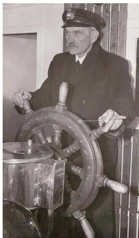
De 2 fotos viser, hvordan det foregik, når lodsene sejlede ud til en lodsning ved Stige samt en lods, der styrer et skib gennem Odense Kanal.