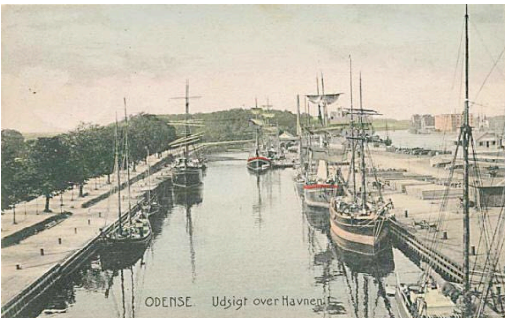
ODENSE. Udsigt over Havnen.