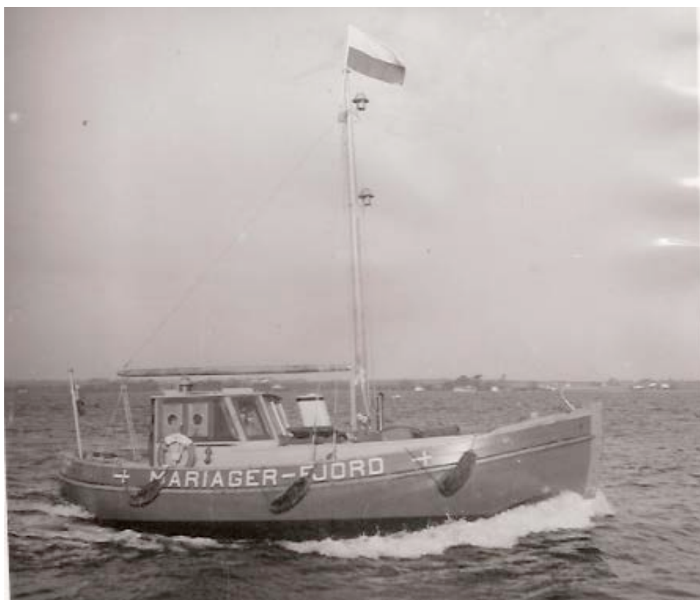
Her ses Mariager-Fjord på jomfrurejsen fra Holbæk til Mariager.

Lodserne benyttede i begyndelsen deres egne både, men lodseriet fik senere egne både, der alle blev finansieret af lodsvæsenet og bygget på forskellige danske værfter.