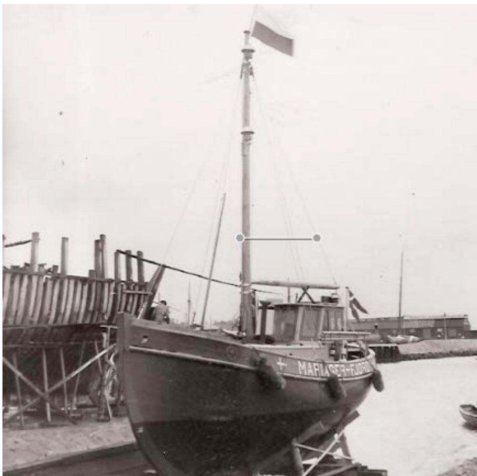
Her ses lodseriets lodsbåd "Mariager-Fjord" ved søsætningen i oktober 1942 på Holbæk Skibs- og Baadebyggeri i Holbæk.