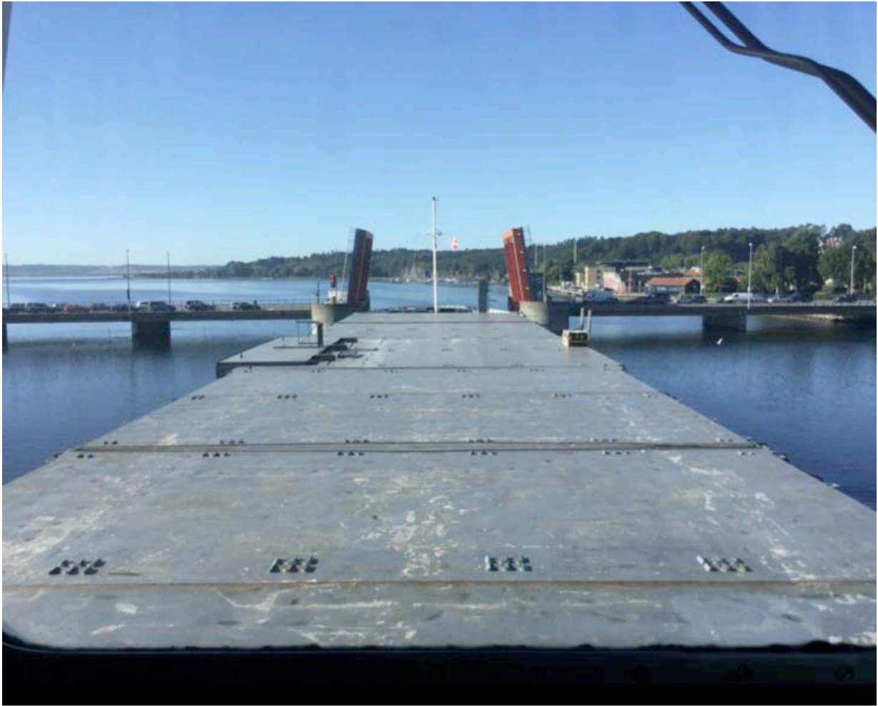
Der ikke er meget plads, når et langt, bredt skib skal passere Hadsundbroen. Nedenfor et glimt af de tidligere strenge vintre, hvor der skulle banes vej gennem isen i fjorden.