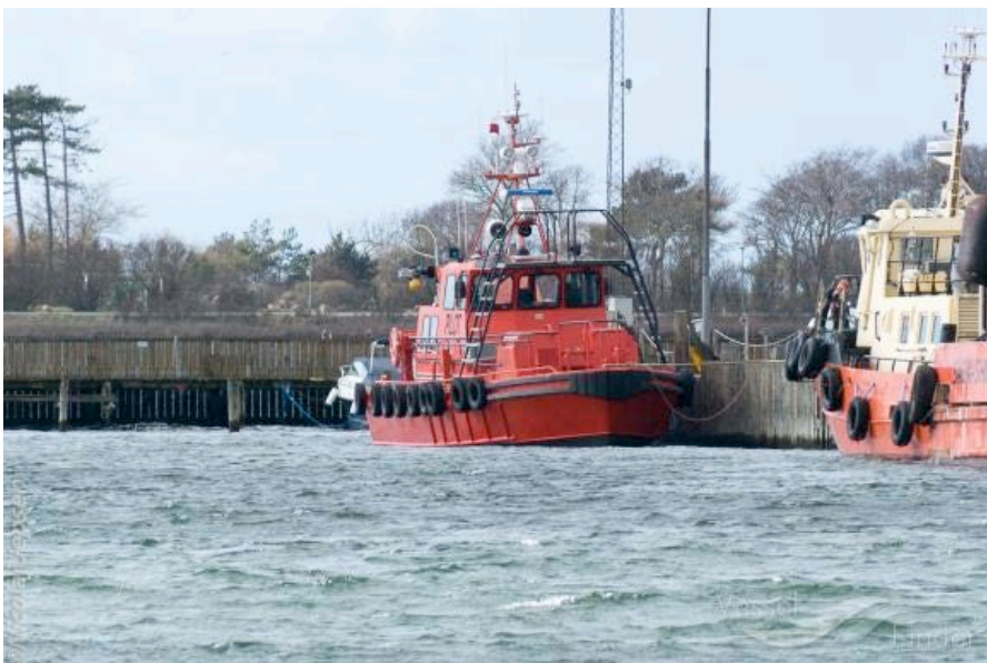
På fotoet til venstre ses en af DanPilots lodsbåde og en Belt Supply båd i Kalundborg Havn.

Kalundborg Lokalarkiv har Kalundborgs Lodseris arkiver fra 1805 til 1990, der bl.a. rummer forordninger, reglementer, bekendtgørelser, instrukser for lodserne, lodsernes aflønning, pensionsforhold, avisudklip og billeder af en af lodseriets lodsbåde, bygget af Roskilde Baadeværft i 1967, en beskrivelse af tårnets historie samt fotografier af lodser. I dag er Kalundborg Havn Sjællands største korneksporthavn og den eneste offentlige dybvandshavn på Sjælland.