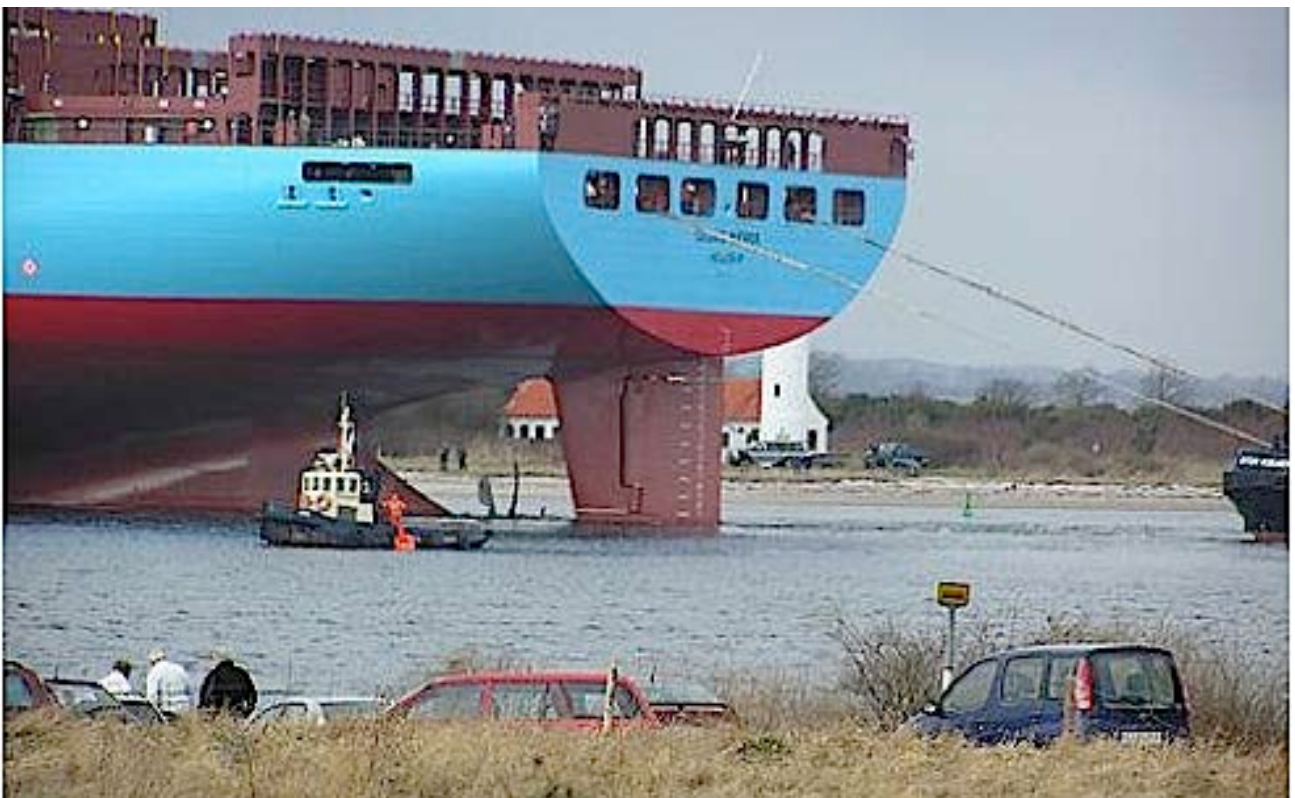
Nederst. Her ses størrelsesforholdet mellem et andet Mærsk containerskib, bygget på Lindøværftet, og en slæbebåd.