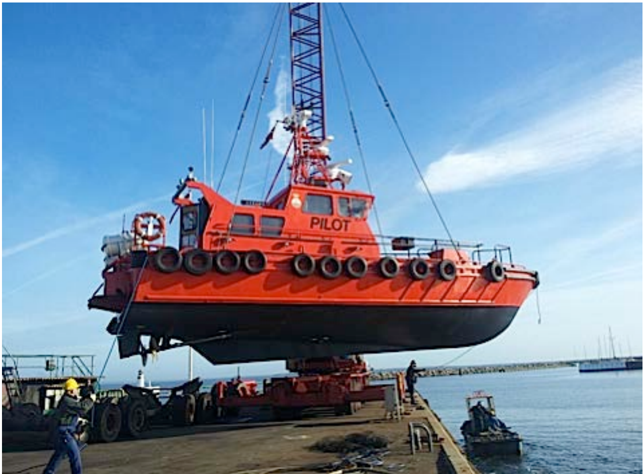
Her ophales Sirius på havnen i Søby på Ærø, hvor Søby Skibsværft skulle udskifte en tæret plade på boven.