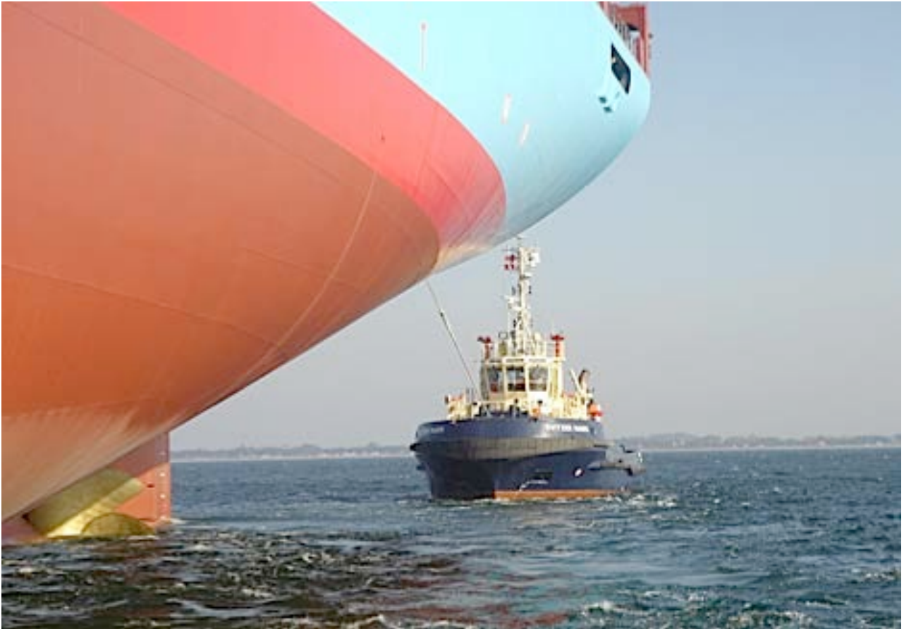
Øverst. Her trækker Svitzer og lodser DanPilot containerskibet Gudrun Mærsk ud fra Lindøværftet i 2005.