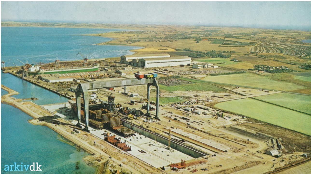
Lindøværftet 1969-1970. I baggrunden ses værftets boligby.

Lindøværftet og Munkebo er udpeget som kulturarv af Slots- og Kulturstyrelsen og er et af de 25 nationale industriminder, der illustrerer industrihistorien i perioden 1950-1970. Det er udpeget som nationalt industriminde, fordi det er den eneste tilbageværende repræsentant for den tidligere blomstrende danske skibsværftsindustri. Det er karakteriseret af masseproduktion af skibe og er et skoleeksempel på en planlagt fabriksby fra den tredje industrialiseringsbølge mellem 1950 og 1970.