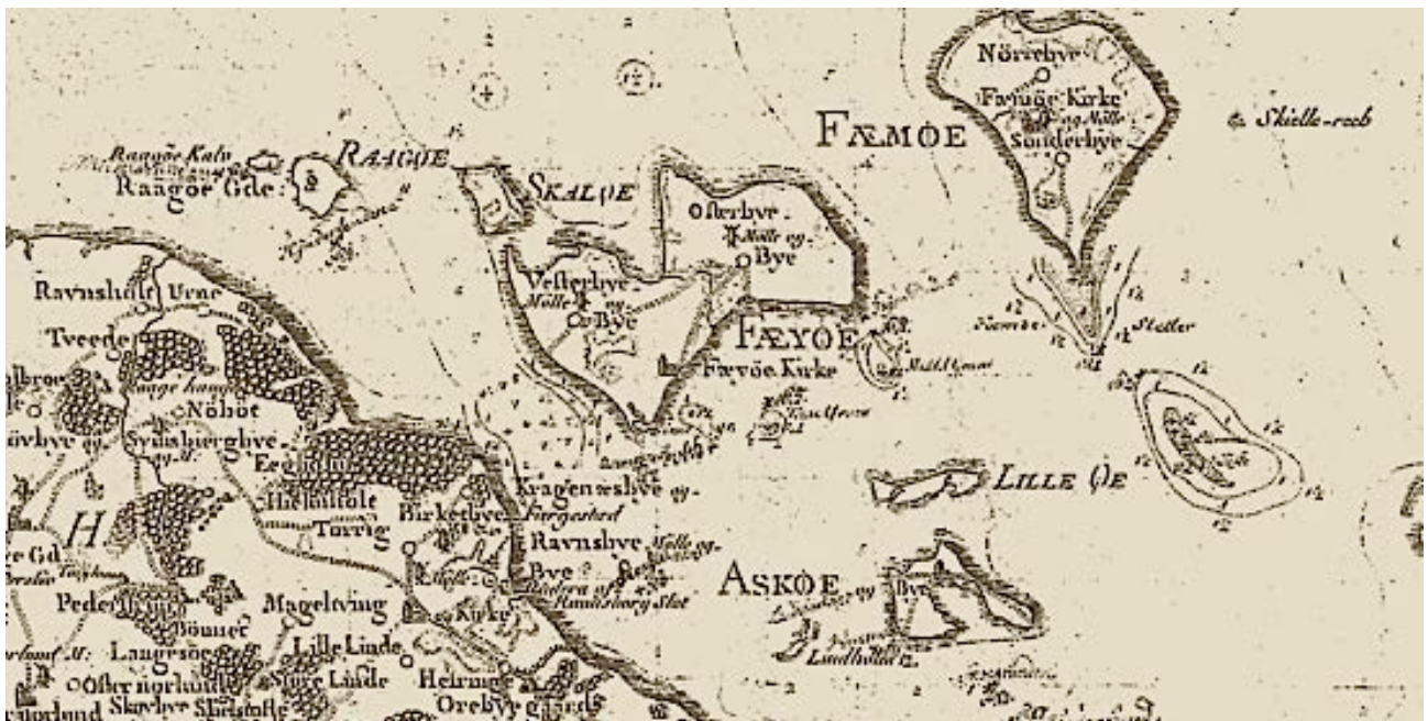
På kortet ovenfor fra 1776 kan ses, hvor svært det er at sejle mellem de mange øer og lavvandede grunde mellem øerne. Femø Lodseri blev nedlagt omkring 1930 og overgik til Guldborg Lodseri.