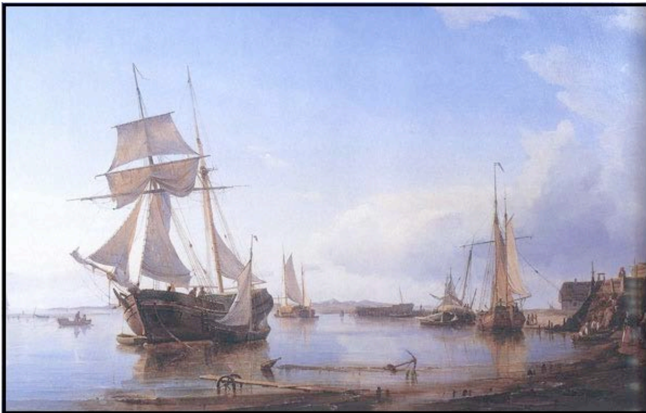
C.F. Sørensen har malet dette maleri i midten af 1800-tallet af sejlskibe ud for Nordby. I baggrunden ses et skibsværft.