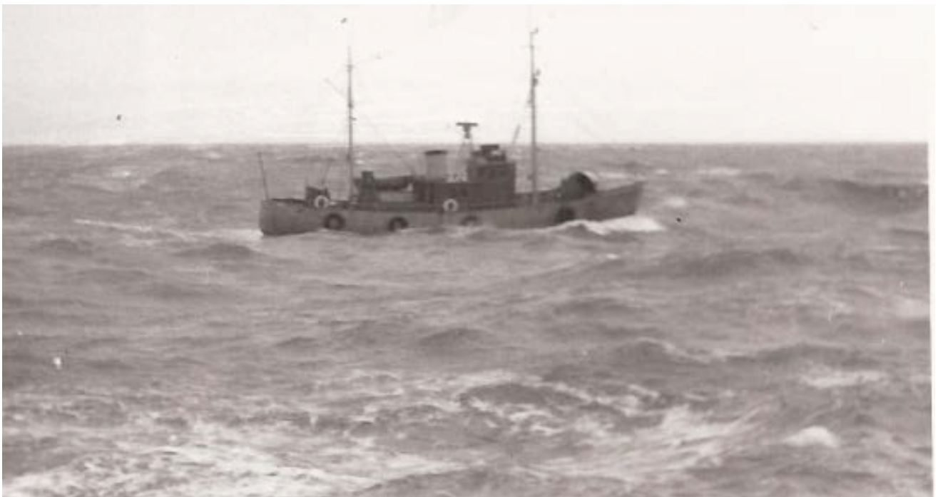
At der stilles særlige krav til lodsbåde, der lodser ud for Esbjerg, illustreres af fotografiet af Esbjerg Lods taget ud for Grådyb Barre.