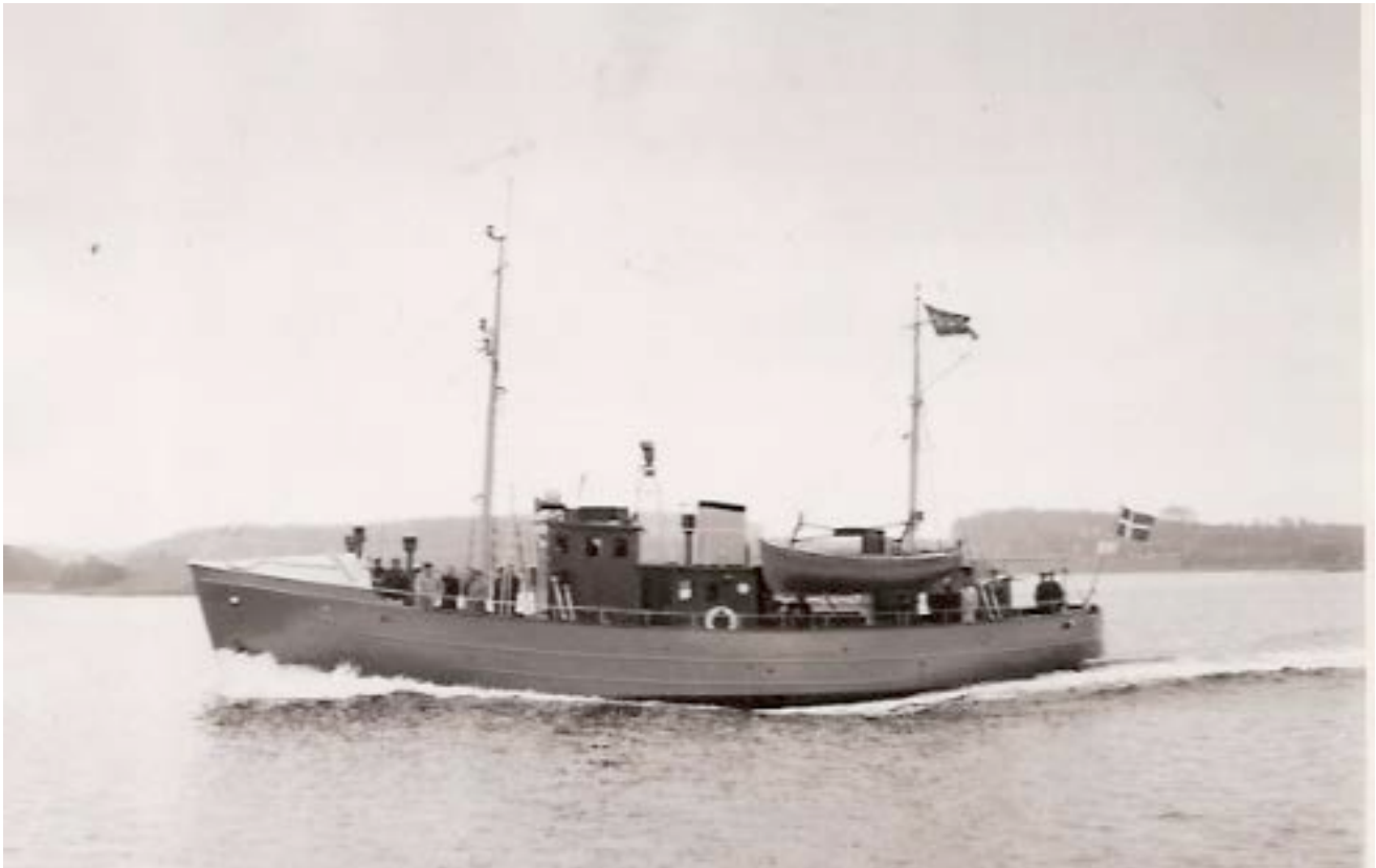
Lodsmotorskibet "Esbjerg Lods" var et stålskib, der blev bygget i 1952 på Svendborg Skibsværft. Det vejede ca. 75 brt. og var udstyret med en Alpha dieselmotor med 200 HK. De mange personer på lodsmotorskibet skyldes, at fotoet er taget af Lodsdirektoratet på prøvesejladsen.