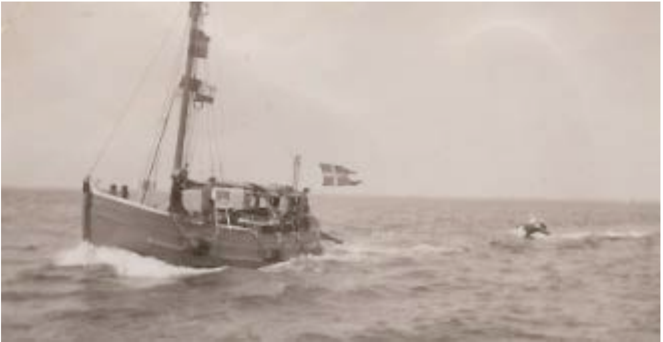
På fotoet ovenfor ses Esbjerg Lodseris lille lodskutter ved Skallingen i 1928. Lodskutteren blev senere solgt til havnelodseriet i Århus.