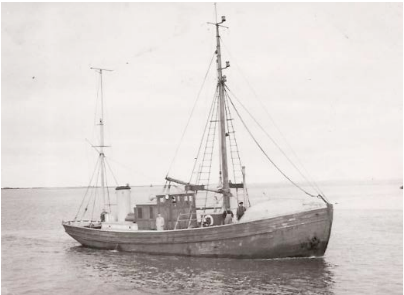
Fotoet viser lodsmotorkutteren "Esbjerg", der blev bygget i 1912 på R. Møllers Skibsværft i Fåborg og vejede næsten 47 brt. Skroget var bygget i eg, dæksplankerne var af fyr, og styrehuset var bygget i teak. Skroget og skibsbunden var forhudet med kobber. Hovedmotoren var en 130 HK B&W motor.