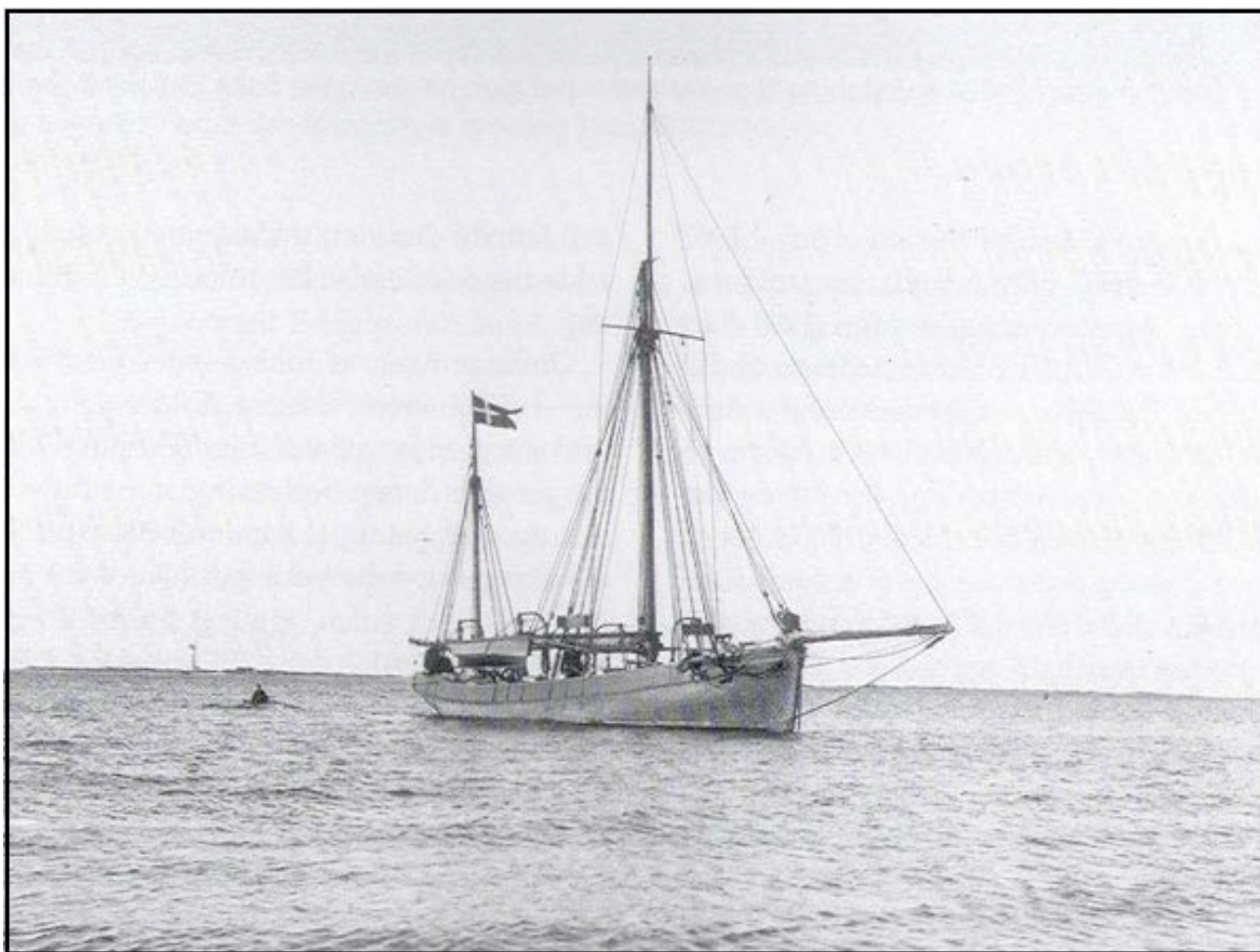
Lodskutteren ”Esbjerg”, der forliste ved en stranding i Sædding efter en voldsom storm i 1911.

Lods fartøjet, der i folkemunde blev kaldt ”Lange Maren”, var indrettet med opholdsfaciliteter til fire lodser i skiftehold, og lodseriet fik en lodsstation i læ af Skallingen. Lods fartøjet egnede sig dog ikke til sejlads uden for Barren, når havet var uroligt. Derfor anskaffede lodseriet senere en mindre dæksbåd, så lods båden kunne påsætte og aftage lods uden for Barren.