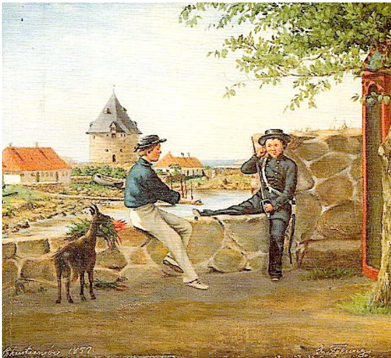
Det smukke vue set fra Christiansø mod Frederikssø er malet af C. Felsing i 1857 (Bornholms Museum).

Christiansø blev anlagt som fæstningsværk i 1684 og bygget i løbet af halvandet år af ca. 300 mænd. Fæstningen skulle varetage Danmarks interesser i krige mod andre landes søfartsflåder og til sikring af handelsskibe. Men fæstningen fik ikke større militær betydning før konsekvenserne af det engelske bombardement af København i 1807 ramte Christiansø. På det tidspunkt var Christiansø fæstning både stærkt forfalden, forældet og utilstrækkeligt bemandedt.