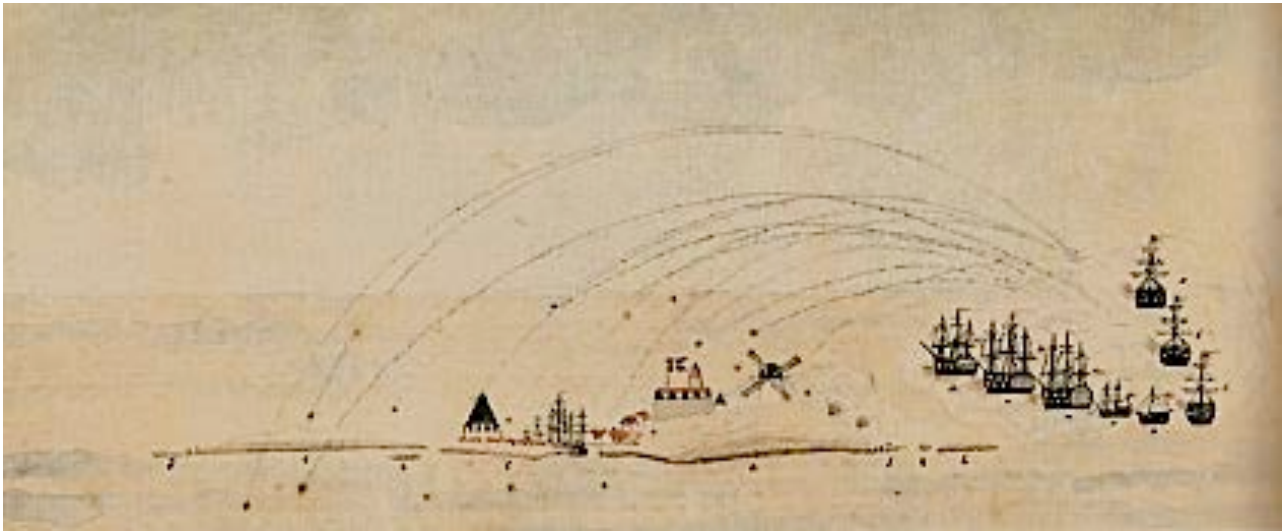
Tegningen viser englændernes beskydning mod Christiansø 24. oktober 1808 (Bornholms Museum)