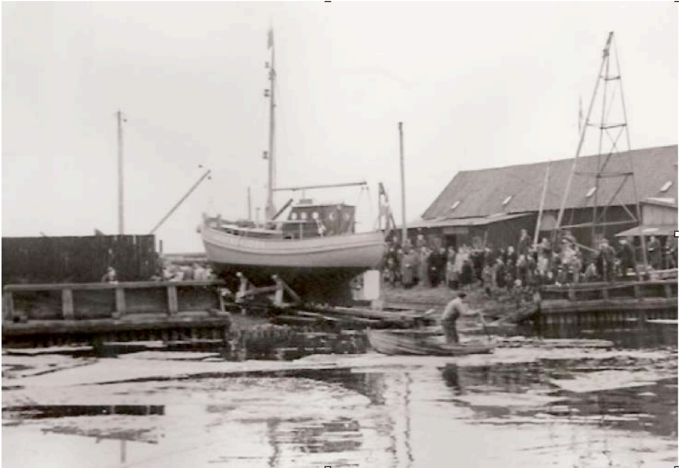
Assens Lods, ejet af Assens Lodseri, er fotograferet af Lodsdirektoratet i 1954. Det øverste foto viser lods båden før stabelafløbningen på Assens Skibs- og Bådebyggeri. Det nederste foto viser lods båden med lodsflag ude på Lillebælt.