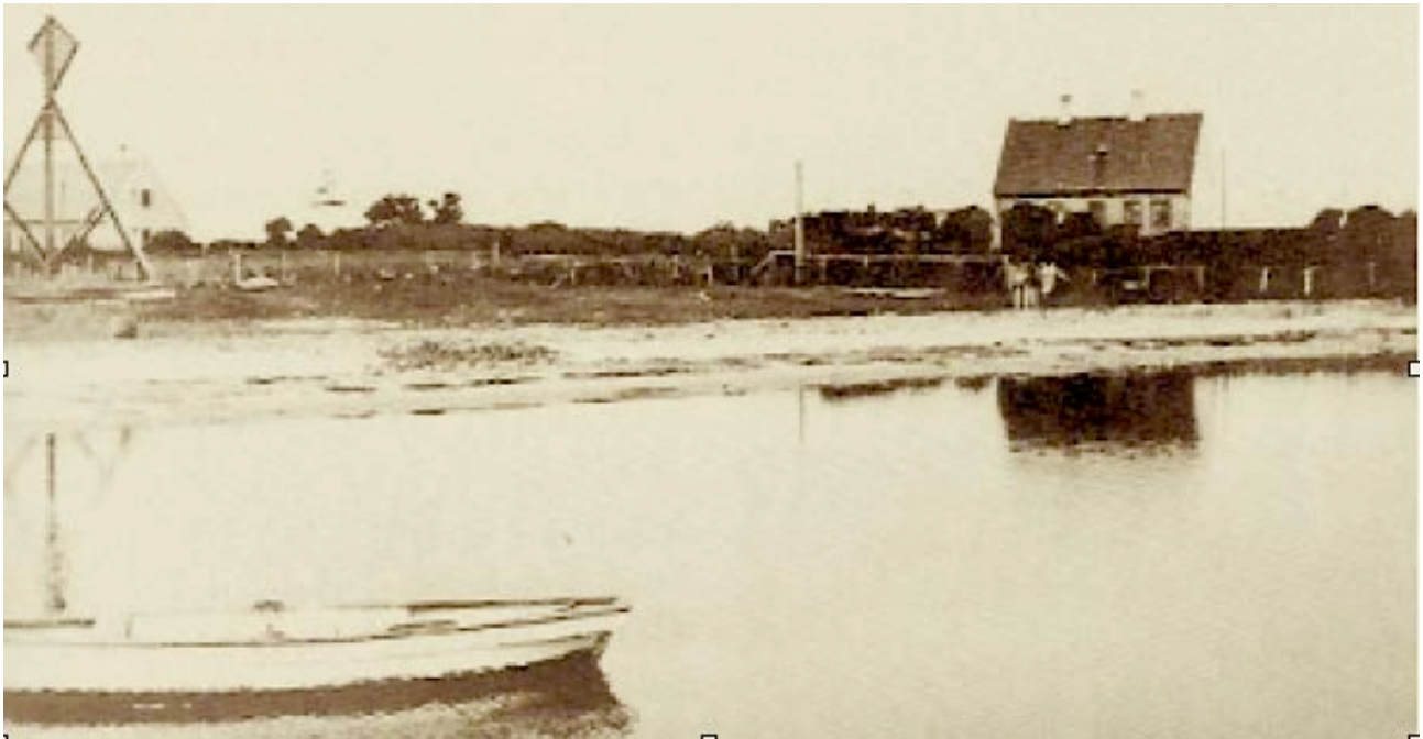
På fotoet ses lodsformandens hus til højre. Bag sømærket skimtes lodshuset, hvor de to lodsfamilier boede. Lodshusene og sømærket er fotograferet af Lodsdirektoratet under en inspektion i 1936.