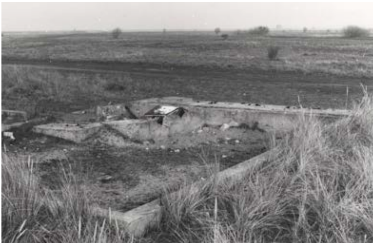
Der er bygget flere lodshuse efter brande og stormfloder.

Lodsvæsenets første overlods for den østlige del af Danmark, Poul Løwenørn, rejste året efter ud-nævnelser den 23. december 1796 som overlods til Lolland og Falster for at inspicere lodserierne. Som et resultat af besigtigelsen af lodseriet på Albuen udstedte han i 1797 et reglement og lodstakster for Albuen Lodseri - faktisk det første efter hans mange inspektioner af de danske lodserier.