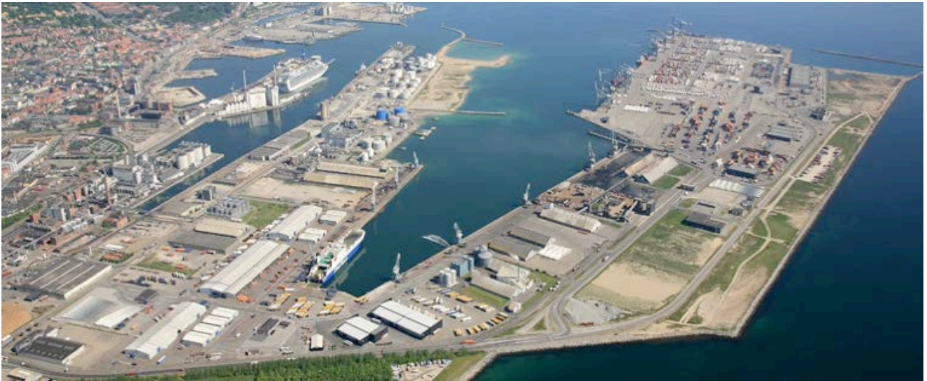
Aarhus Havn er Danmarks største containerhavn med central beliggenhed for bane, biler og skibe.