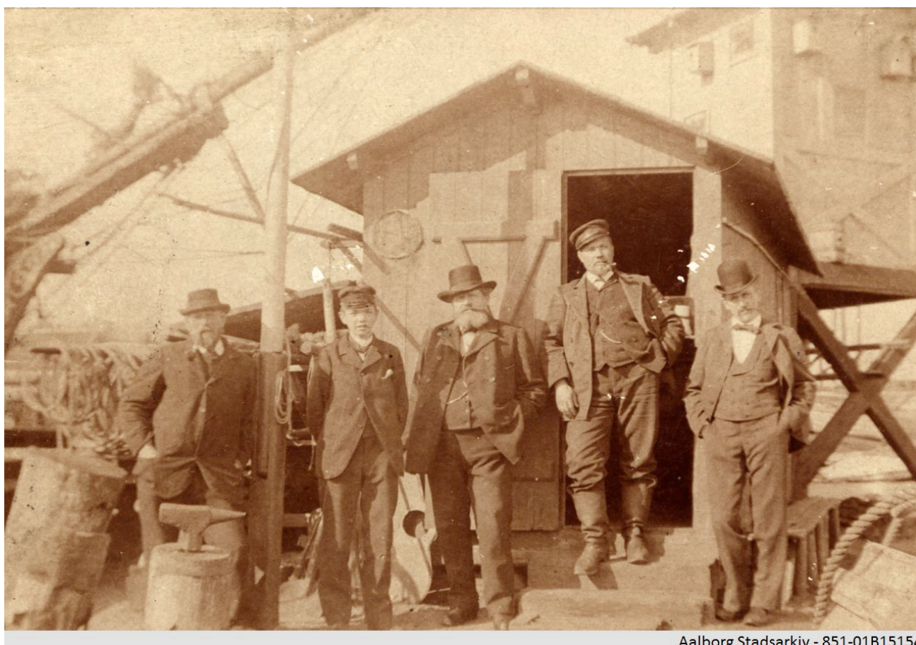
Aalborg Stadsarkiv - 851-01B15154

Nedenfor ses et foto af fem lodser foran en lodsbygning ca. 1910. Foto: Aalborg Stadsarkiv